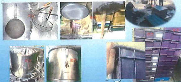
器具定期汰換維修